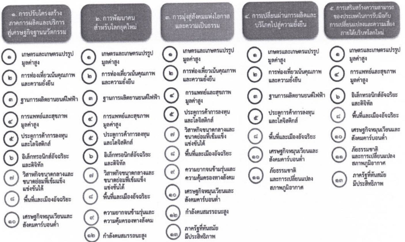
แผนภาพที่ ๓.๑ ความเชื่อมโยงระหว่างหมุดหมายการพัฒนา กับเป้าหมายหลัก

ความเชื่อมโยงระหว่างหมุดหมายการพัฒนา กับเป้าหมายหลักแสดงไว้ในแผนภาพที่ ๓.๑ โดยหมุดหมายการพัฒนาที่กำหนดขึ้นเป็นประเด็นที่มีลักษณะเชิงบูรณาการที่ครอบคลุมการพัฒนาตั้งแต่ในระดับต้นน้ำจนถึงปลายน้ำ และสามารถนำไปสู่ผลพัฒนาทั้งในมิติเศรษฐกิจ สังคม ทรัพยากรธรรมชาติและสิ่งแวดล้อมไปพร้อมๆ กัน ทำให้หมุดหมายแต่ละประการสามารถสนับสนุนเป้าหมายหลักได้มากกว่าหนึ่งข้อ นอกจากนี้การพัฒนาภายใต้แต่ละหมุดหมายไม่ได้แยกขาดจากกัน แต่มีการสนับสนุนหรือเอื้อประโยชน์ซึ่งกันและกัน