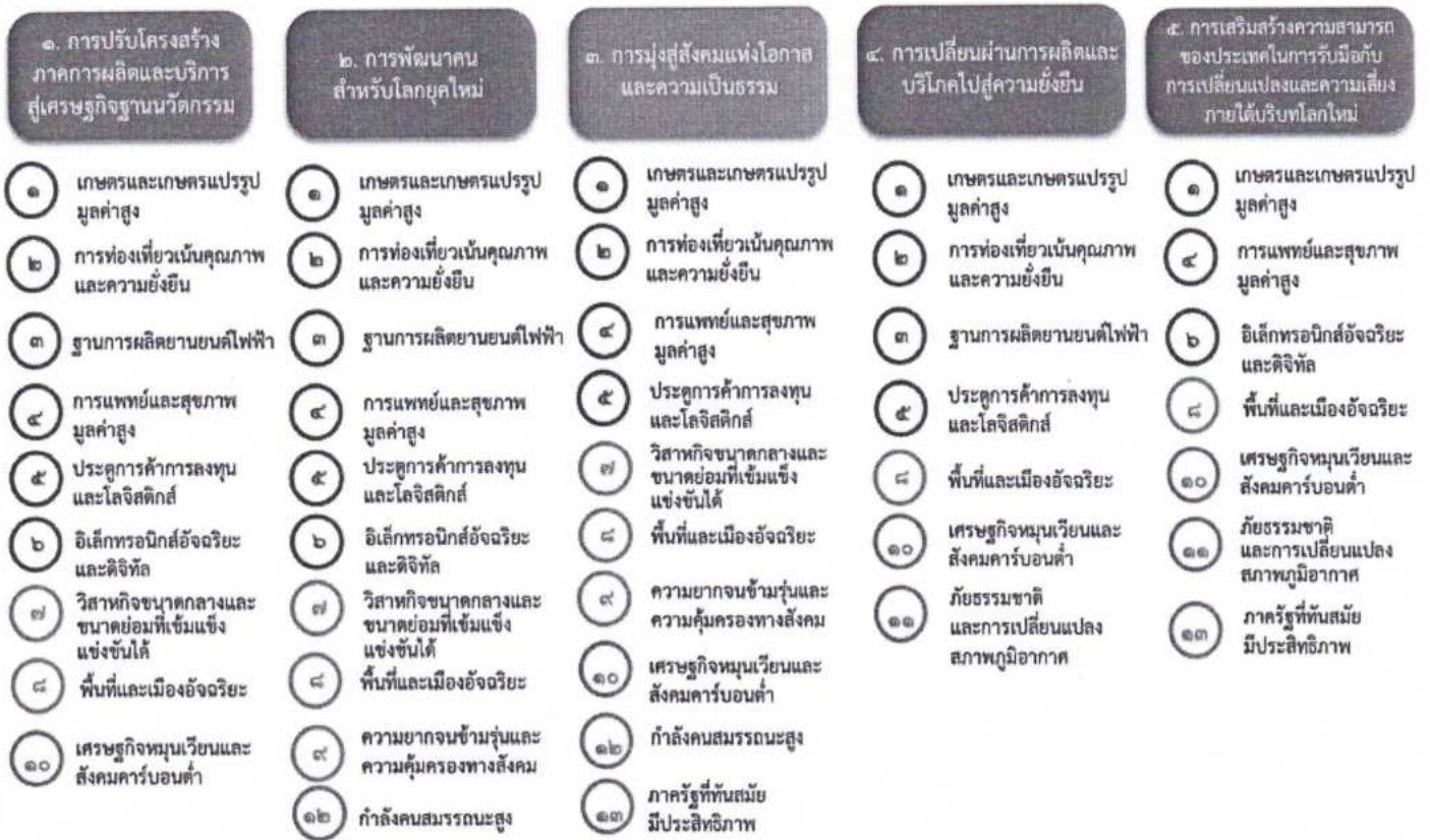
แผนภาพที่ ๓.๑ ความเชื่อมโยงระหว่างหมุดหมายการพัฒนา กับเป้าหมายหลัก

ความเชื่อมโยงระหว่างหมุดหมายการพัฒนา กับเป้าหมายหลักแสดงไว้ในแผนภาพที่ ๓.๑ โดยหมุดหมายการพัฒนาที่กำหนดขึ้นเป็นประเด็นที่มีลักษณะเชิงบูรณาการที่ครอบคลุมการพัฒนาตั้งแต่ในระดับต้นน้ำจนถึงปลายน้ำ และสามารถนำไปสู่ผลพัฒนาทั้งในมิติเศรษฐกิจ สังคม ทรัพยากรธรรมชาติและสิ่งแวดล้อมไปพร้อมๆ กัน ทำให้หมุดหมายแต่ละประการสามารถสนับสนุนเป้าหมายหลักได้มากกว่าหนึ่งข้อ นอกจากนี้การพัฒนาภายใต้แต่ละหมุดหมายไม่ได้แยกขาดจากกัน แต่มีการสนับสนุนหรือเอื้อประโยชน์ซึ่งกันและกัน